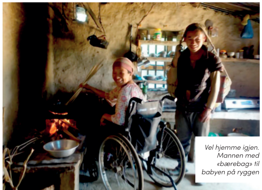
Vel hjemme igjen. Mannen med «bærebag» til babyen på ryggen