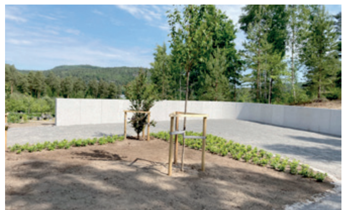
Her er den flunkende nye minnelunden ved Eidanger kirke med muren som skal få plaketter med navn på dem som gravlegges her.